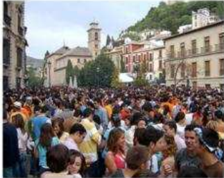
Cuando aumenta de población.